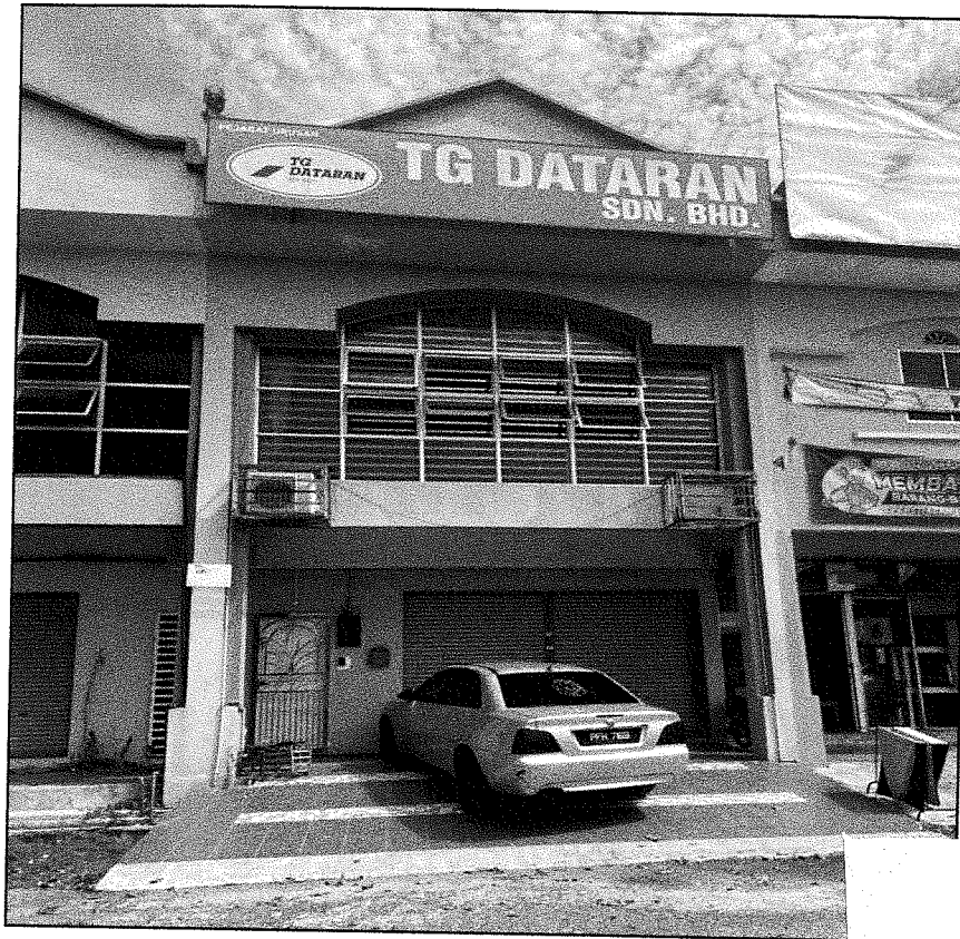
VIEW OF THE SUBJECT PROPERTY