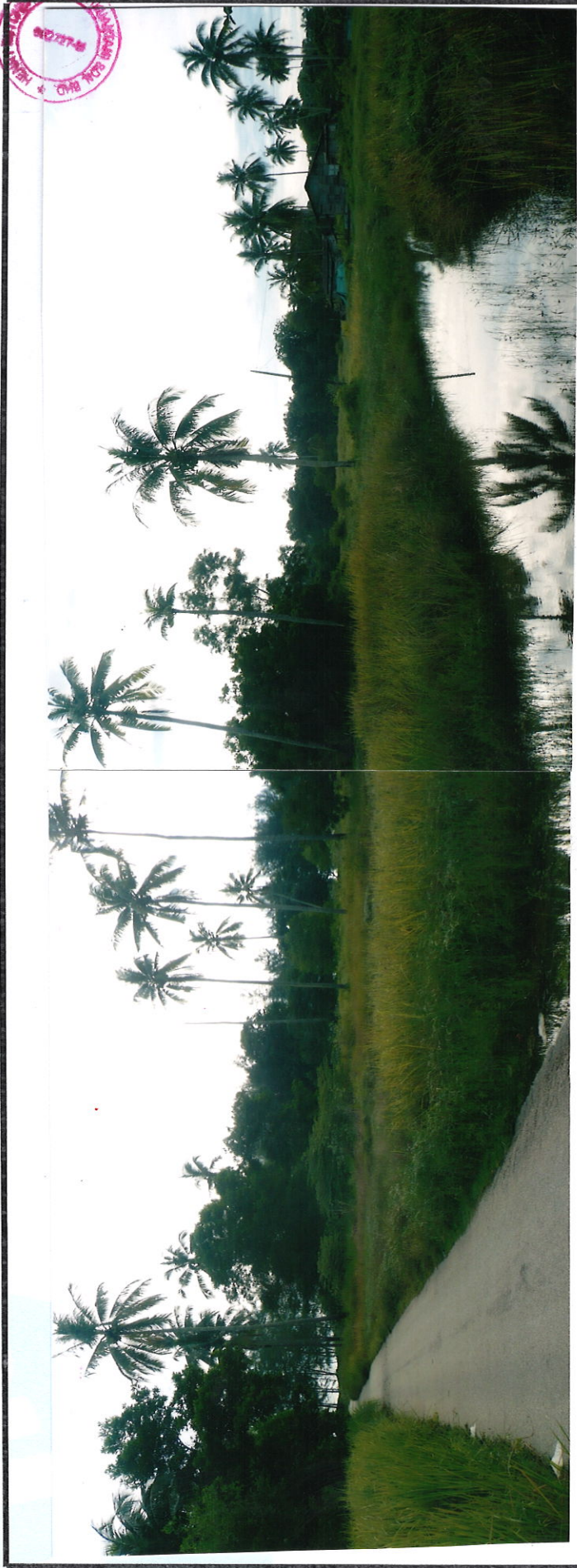
GENERAL VIEW OF THE SUBJECT PROPERTY